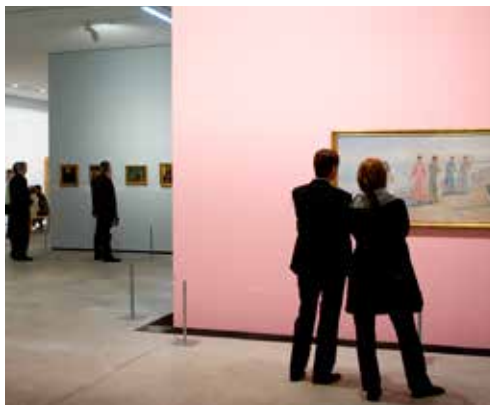
Arkens nyeste udstillingsrum indviet i 2008.