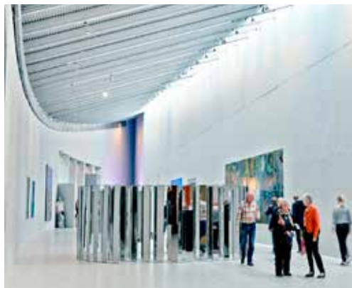
Arkens kunstakse 2013.